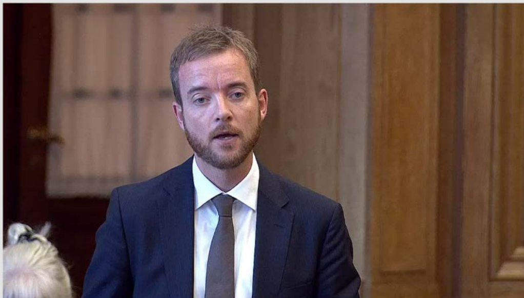
Miljøminister Esben Lunde Larsen, (V), vil alligevel høre om en af Danmarks største forureningssager.