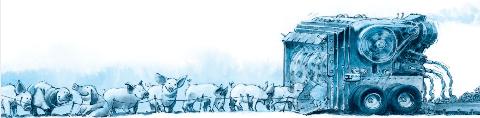
Illustration: Claus Rye Schierbeck