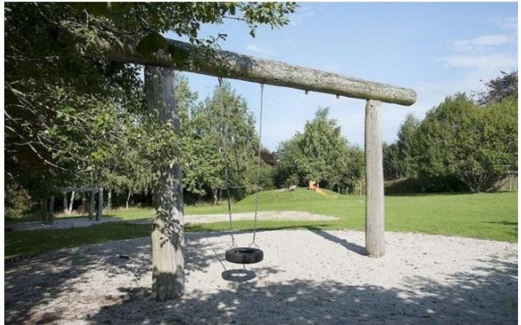
Legepladsen i Græsted Folkepark, hvor der tidligere har være betonproduktion.