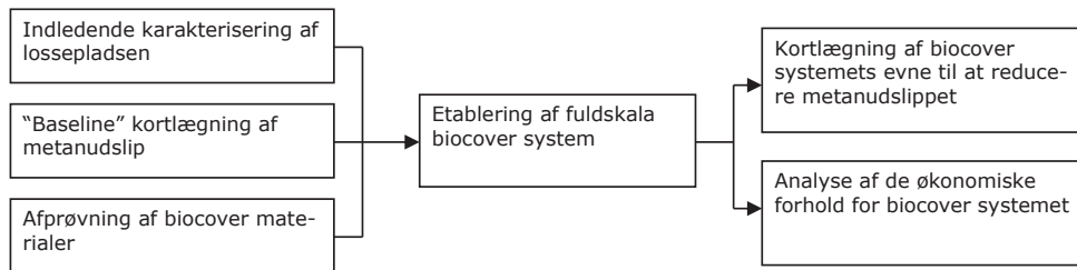
Figur 1. Aktiviteter i protokol for dokumentation af biocoverprojekt.